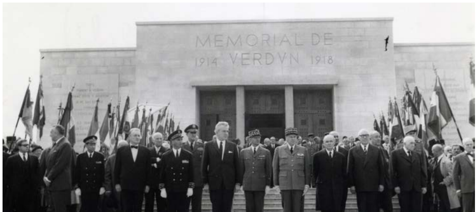
Crédits photos, page 2 à 4, de gauche à droite : Page 2 : Vue aérienne des Épargnes © Jean-Luc Kaluzko ; L'illustration , n° 4055, 20 novembre 1920 - la cérémonie d'inhumation du Soldat inconnu © Mémorial de Verdun / Page 3 : Maurice Genevoix, cinq jours avant le début de la bataille des Épargnes, 12 février 1915 ; Maurice Genevoix en tenue d'académicien, années 1960 © Famille Genevoix ; Nicolas Mallarte & Thomas Duran ; Christophe Malavoy © Droits réservés ; Mémorial de Verdun, vue extérieure © Mémorial de Verdun / Page 4 : Inauguration du Mémorial de Verdun, le 17 septembre 1967 © Mémorial de Verdun.

Maurice Genevoix, discours inaugural du Mémorial de Verdun, 17 septembre 1967.