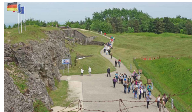
Fort de Douaumont