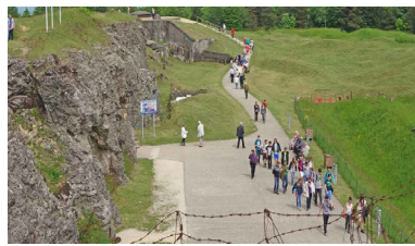
Fort de Douaumont