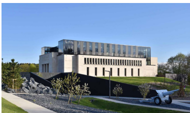
Mémorial de Verdun

Visiter le Champ de bataille de Verdun et ses grands sites constitue une expérience essentielle.