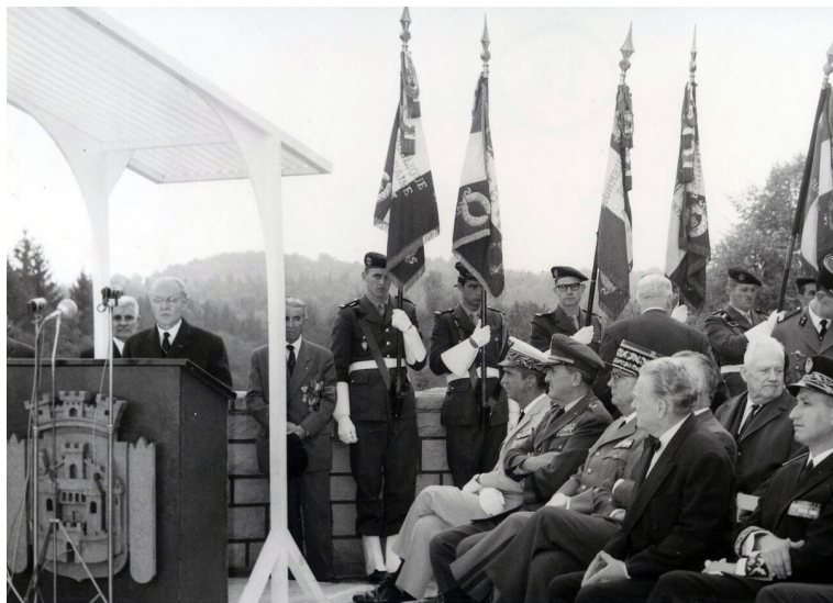
Discours de Maurice Genevoix pour l'inauguration du Mémorial de Verdun en 1967

Tels des vitraux modernes, cette création jouera sur la symbolique de la lumière de la Flamme olympique et celle du discours de Maurice Genevoix, lors de l'inauguration du Mémorial de Verdun : « Puisse la lumière qui va veiller ici nous guider enfin vers la Paix. » L'arrière-petit-fils de l'écrivain et fondateur du Mémorial de Verdun, Simon Larere-Genevoix, portera la Flamme sur le parvis du Mémorial.