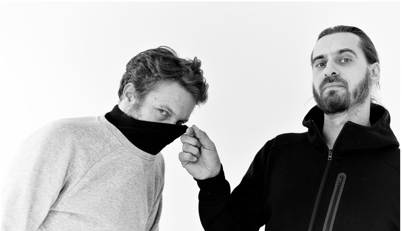
Lek & Sowat © Maya Angelson

Le Mémorial de Verdun est un lieu emblématique de l'histoire française et européenne. C'est à ce titre qu'il a été désigné lieu iconique pour accueillir le passage de la Flamme olympique de Paris 2024, le 29 juin 2024. À cette occasion, le Mémorial de Verdun - Champ de bataille a invité les artistes Lek & Sowat à réaliser une oeuvre sur le Mémorial, des vitraux modernes, autour de la symbolique de la lumière. Un événement hautement symbolique pour délivrer un message universel de paix.