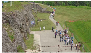
Fort de Douaumont