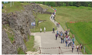
Fort de Douaumont