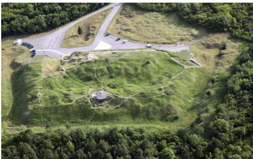
Vue aérienne du Fort de Vaux

Le parcours de visite fera revivre le siège du Fort de Vaux tenu du 2 au 7 juin 1916 - épisode héroïque de l'enfer de Verdun - à travers des dispositifs immersifs, visant à toucher un large public : scolaires, familles, passionnés d'histoire ou simples curieux.