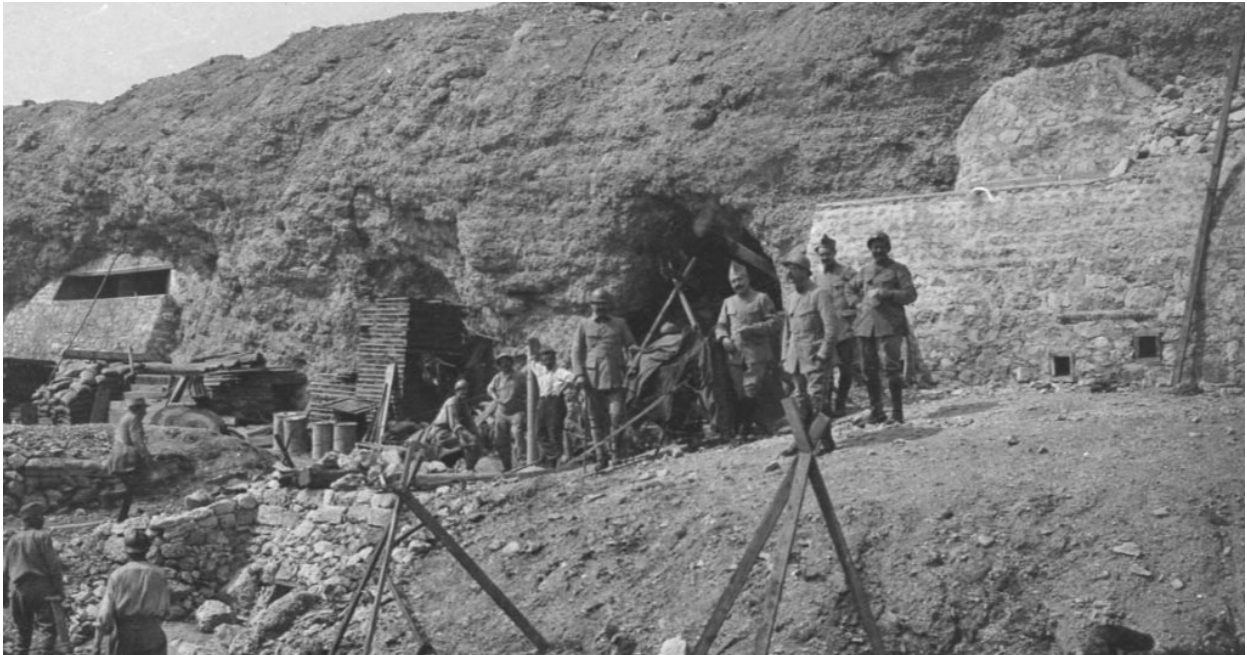
Entrée du Fort de Vaux, vue extérieure, 11 juin 1917