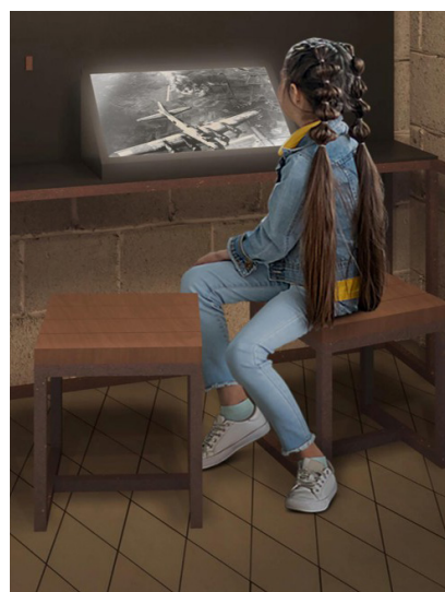
Prévisualisations du futur parcours de visite

C'est la première fois, depuis l'ouverture du site à la visite dans les années 1920, que le Fort de Vaux est pleinement reconnu comme un patrimoine à préserver et à valoriser. La pierre que nous posons ce lundi 10 novembre marque à la fois l'aboutissement d'un long travail et le début d'une nouvelle étape pour le champ de bataille de Verdun.