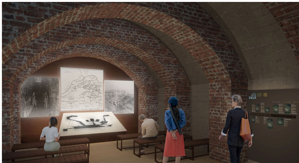
Prévisualisations du futur parcours de visite

Le budget total du projet s'élève à 5 millions d'euros. Les principaux financeurs sont le Département de la Meuse, la Région Grand Est, l'Union Européenne, l'État avec la Direction de la Mémoire, de la Culture et des Archives du Ministère des Armées et le Fonds National d'Aménagement et de Développement du Territoire. Le projet est aussi financé grâce à des mécènes privés.