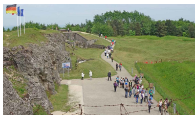
Fort de Douaumont