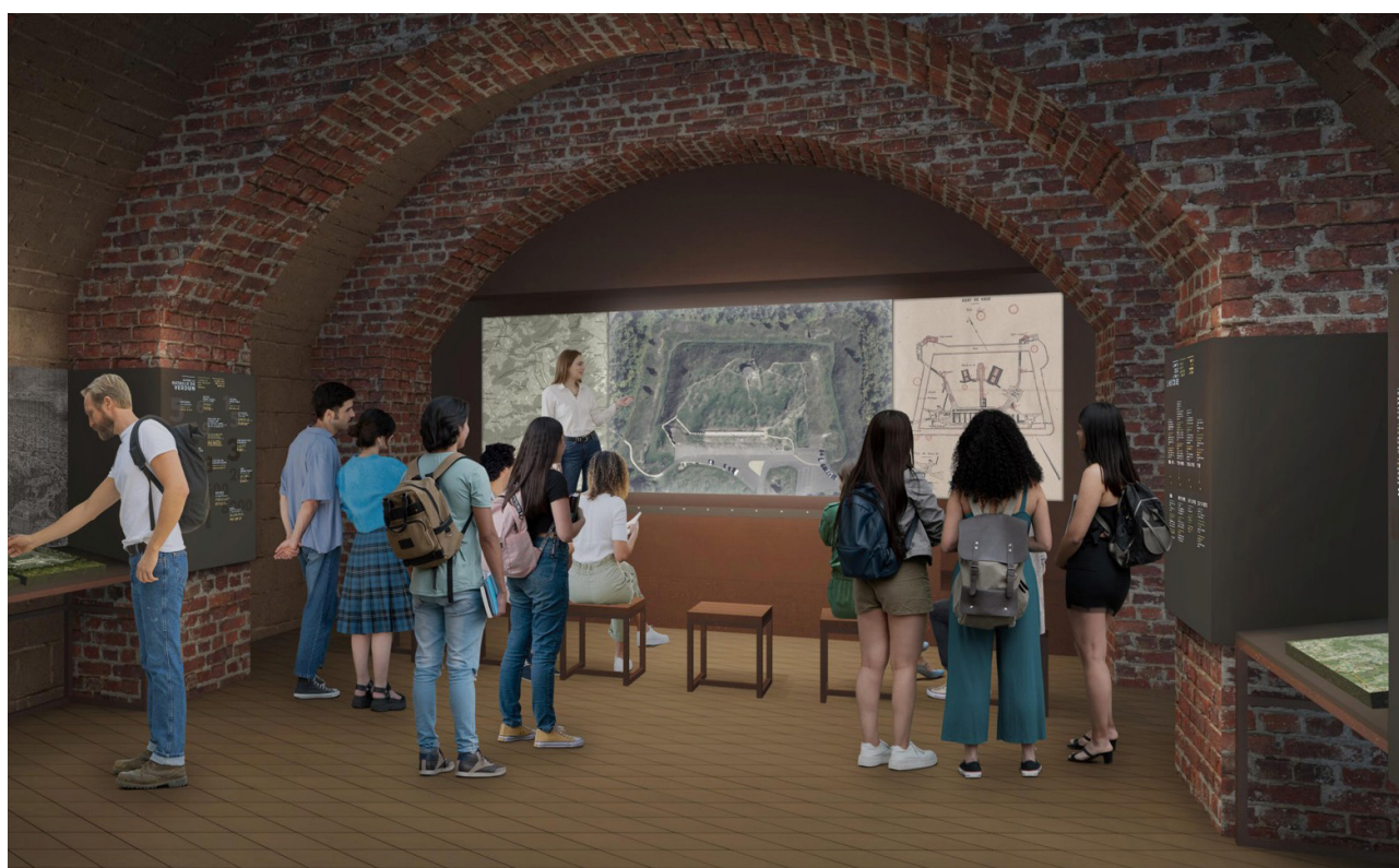
Prévisualisation du futur parcours de visite © La Fabrique Créative

Classé monument historique depuis 1970, le Fort de Vaux s'apprête à connaître une rénovation d'envergure de son parcours de visite - une première depuis son ouverture au public dans les années 1920. Témoin majeur de la bataille de Verdun et haut lieu de mémoire, le Fort de Vaux - comme celui de Douaumont - joue un rôle central dans la transmission de l'histoire de la Première Guerre mondiale. Ce projet ambitieux, soutenu par le Département de la Meuse, la Région Grand Est, l'État, l'Union européenne et plusieurs mécènes privés, réunit historiens, architectes et scénographes. Il vise à préserver l'authenticité du site tout en renouvelant l'expérience de visite et la manière de raconter l'Histoire.