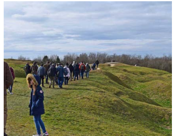
Les dessus du fort de Douaumont

TARIF : 10€ par adulte, 5€ pour les 8-16 ans, gratuit pour les adhérents Durée de visite : 1h. RÉSERVATIONS OBLIGATOIRES.