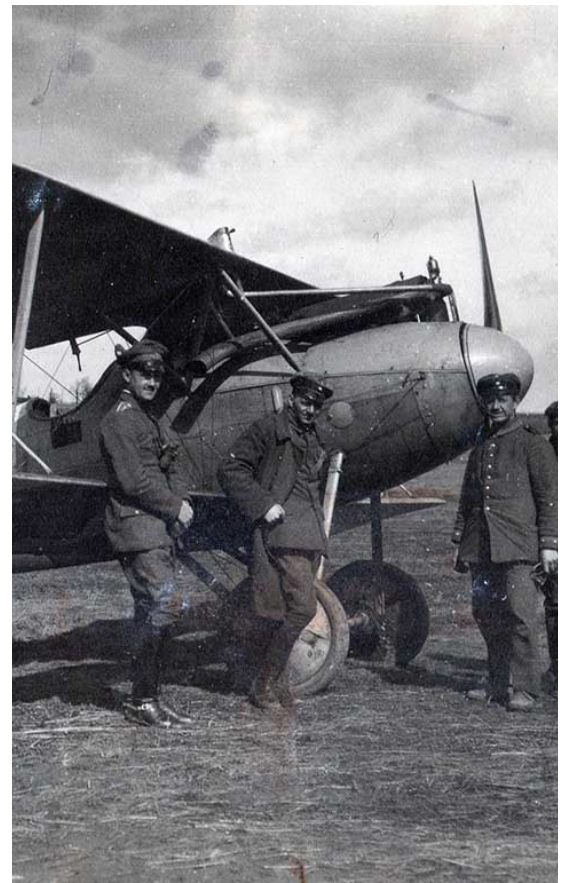
Aviateurs allemands posant devant un Albatros DV. Photographie allemande, 1918.

Réservations sur www.memorial-verdun.fr ou par téléphone au +33 (0)3 29 88 19 16 ou par e-mail à l'adresse suivante info@memorial-verdun.fr