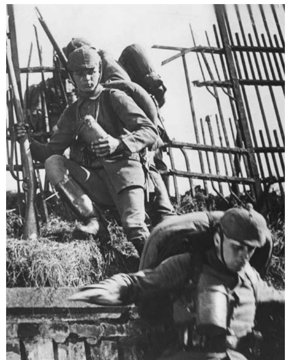
Photographie d'une image extraite du documentaire Douaumont - Die Hölle von Verdun (Douaumont, l'enfer de Verdun) 1931, par Heinz Paul.

Ciné-débat GRATUIT . Nombre de places limité, réservations vivement conseillées .