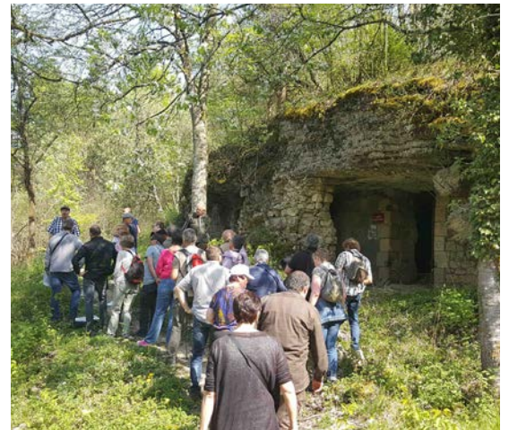
Circuits historiques sur le Champ de bataille de Verdun, photographie 2020