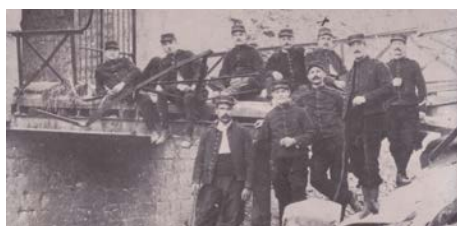
Artilleurs posant devant l'entrée du fort de Liouville