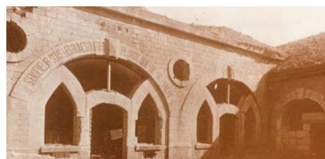
Cour n°1 du fort de Liouville 1915