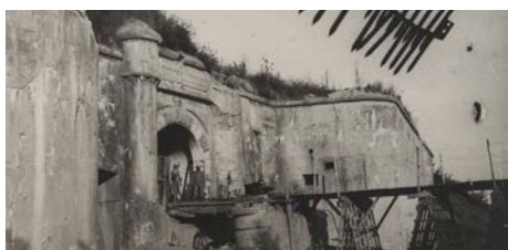
L'entrée du fort de Manonvillier 1916