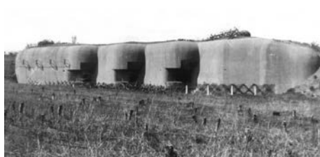
Ligne Maginot : Bloc 7 ouvrage du Kobenbusch