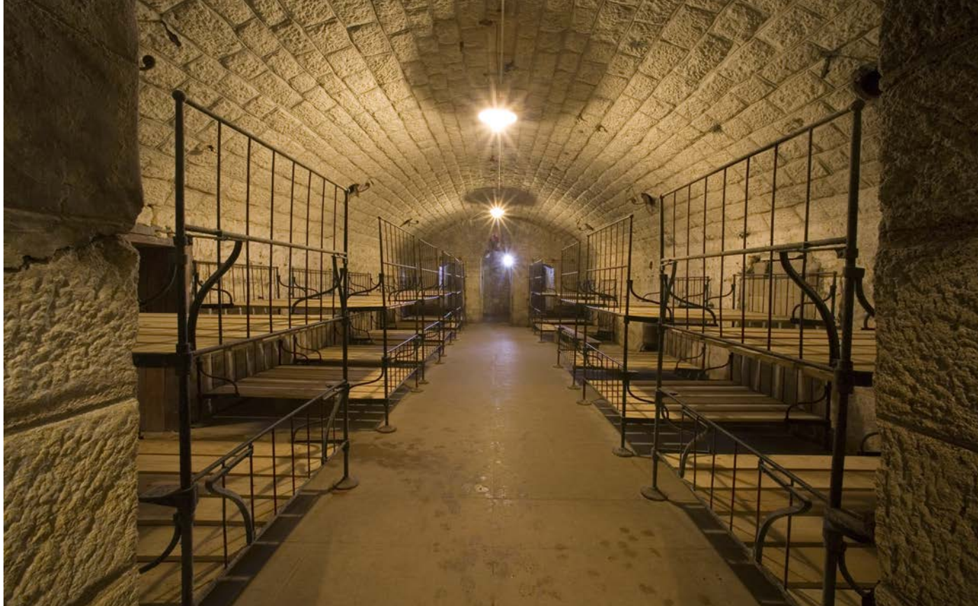
Fort de Douaumont : Une casemate de la caserne du fort de Douaumont