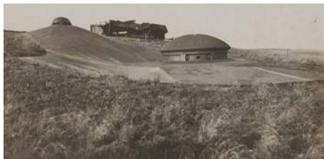
Tourelle de 75 mm, fort de Moulainville janvier 1916