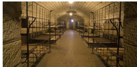
Casemate de la caserne du fort de Douaumont