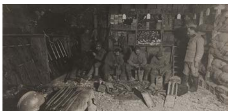
Soldats français dans une casemate de Douaumont