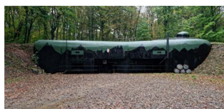
Ligne Maginot : Entrée de l'ouvrage du bois de Bousse