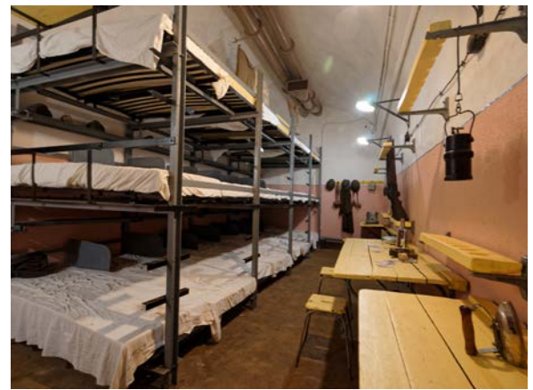
Ligne Maginot : Ouvrage du bois de Bousse

Sauvés du pillage ou de la destruction, ces forts et ouvrages forment aujourd'hui un ensemble d'un grand intérêt patrimonial et mémoriel. Il s'agit en effet d'un patrimoine exceptionnel : peu de régions dans le monde présentent un ensemble d'architectures militaires aussi diversifié et sur une période aussi longue.