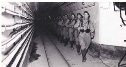
Soldats de l'équipage d'un gros ouvrage Maginot remontant au pas une des galeries du fort. Photographie, années 1930.