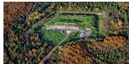
Vue aérienne du fort de Vaux. Photographie contemporaine, s.d.