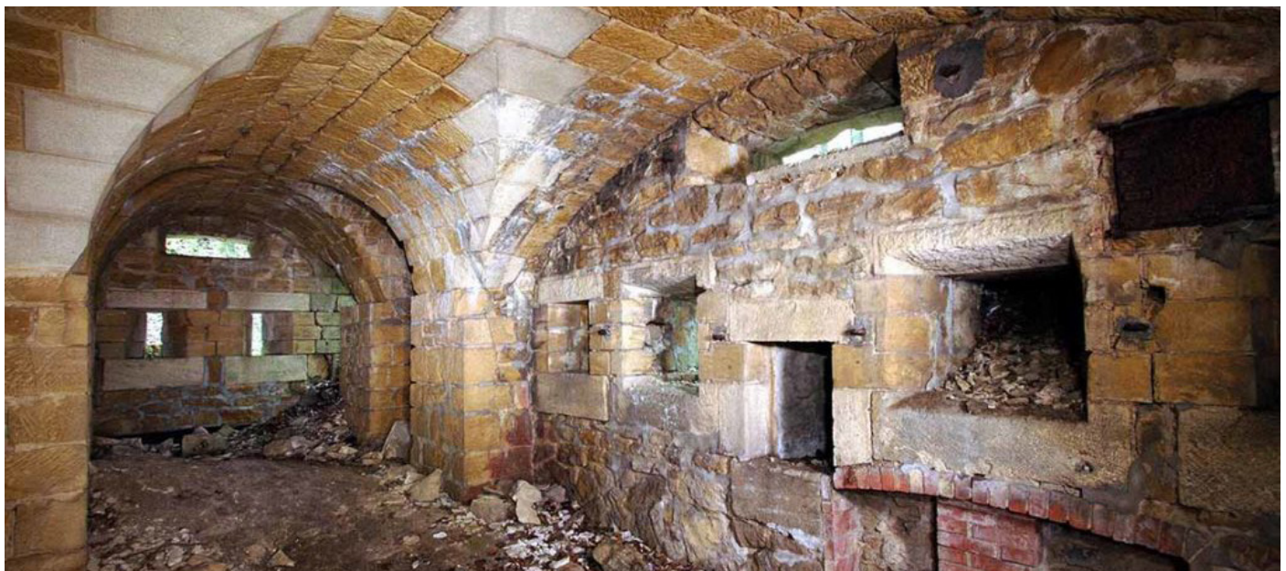
Intérieur d'une des caponnières simples du fort de Souville. Photographie, s.d.

Chaque session sera enregistrée et ensuite disponible en replay sur la chaîne Youtube du Mémorial de Verdun.