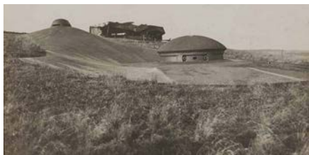
Tourelle de 75 mm, fort de Moulainville. Photographie, janvier 1916. (Val. 196/088)