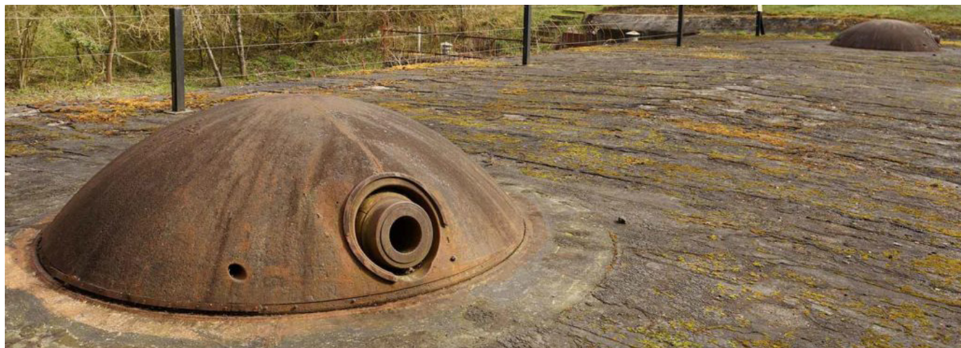
Feste Wagner (Vermy). Photographie contemporaine, s.d.