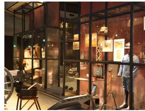
Muséographie Mémorial de Verdun. Les artilleurs à Verdun

Le dernier étage, baigné de lumière, s'ouvre sur l'environnement du Mémorial. Les visiteurs peuvent accéder aux terrasses et découvrir le panorama. Des bornes multimédia racontent l'histoire du champ de bataille. Elles présentent des images aériennes contemporaines qui révèlent les traces de la guerre, aujourd'hui cachées par la forêt. Une exposition temporaire est accessible à ce niveau ainsi qu'un centre de documentation.