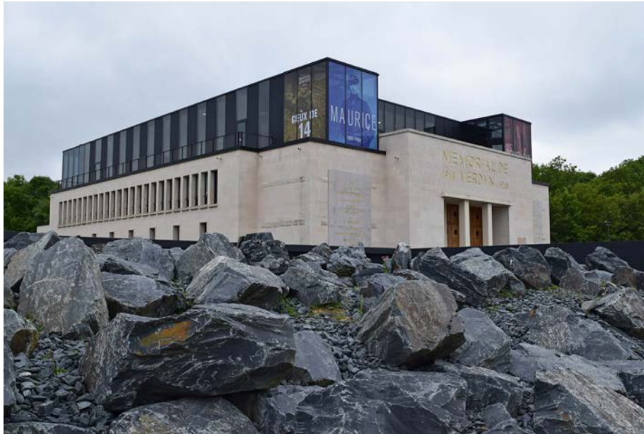
Mémorial de Verdun, vue extérieure.