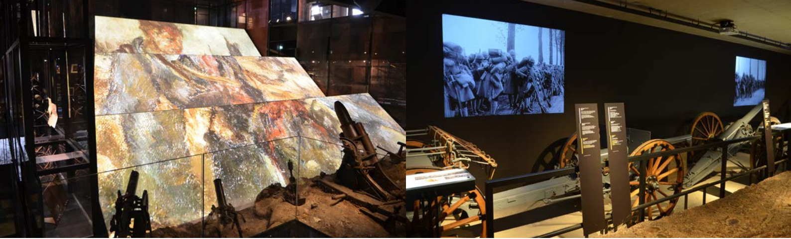
Muséographie Mémorial de Verdun. Le champ de bataille.