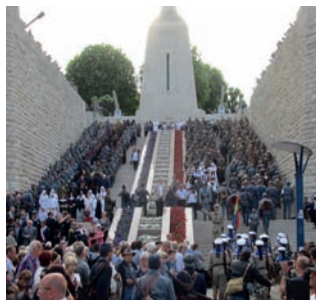
Centenaire Verdun, 2016 © Réf 55