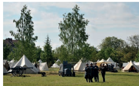
Centenaire Verdun, 2016 © Luc Pottiez