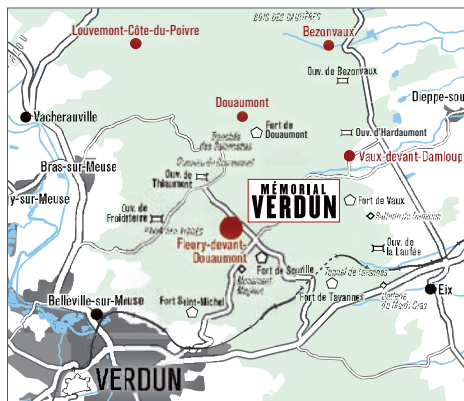
Carte du champ de bataille