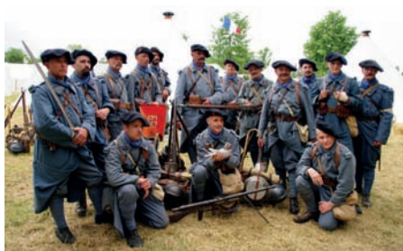
Centenaire Verdun, 2016 © Réf 55